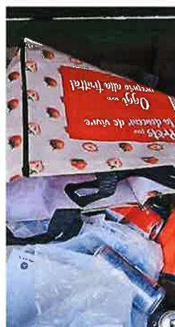
Plastiques et alu dans la benne à papier