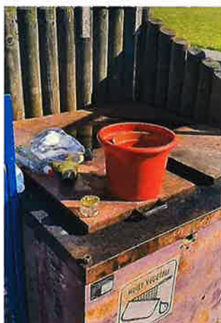
Déchets non valorisables à éliminer dans un sac poubelle