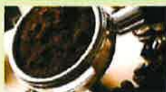
Marc de café