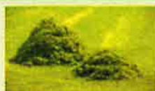
Tonte de gazon