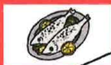
Poissons, huîtres, moules