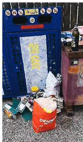
Déchets laissés au sol