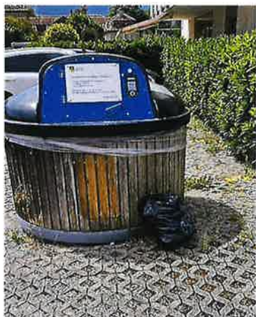
Sac poubelle à côté du Molok