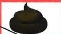
Crottes de chiens